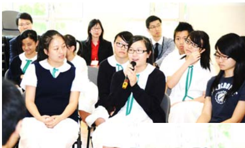
Students participating actively in the Liberal Studies Salon