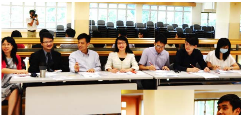
ESR team leader in English musical audition 外評隊長出席 英語音樂劇遴選