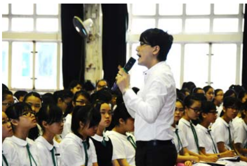
SI Youth Forum Training: teacher and student sharing presentation skills 中一英語青年論壇訓練： 老師及同學與中一同學 分享演說技巧