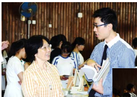
ESR team member visiting our book exhibition and interviewing our Teacher Librarian 外評隊隊員參與書展及與圖書館主任面談