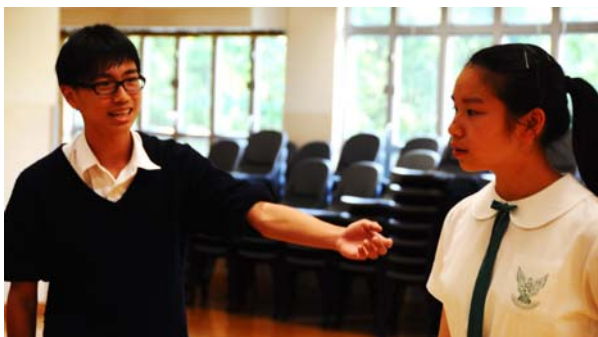
Students' vibrant acting 同學的演技精湛