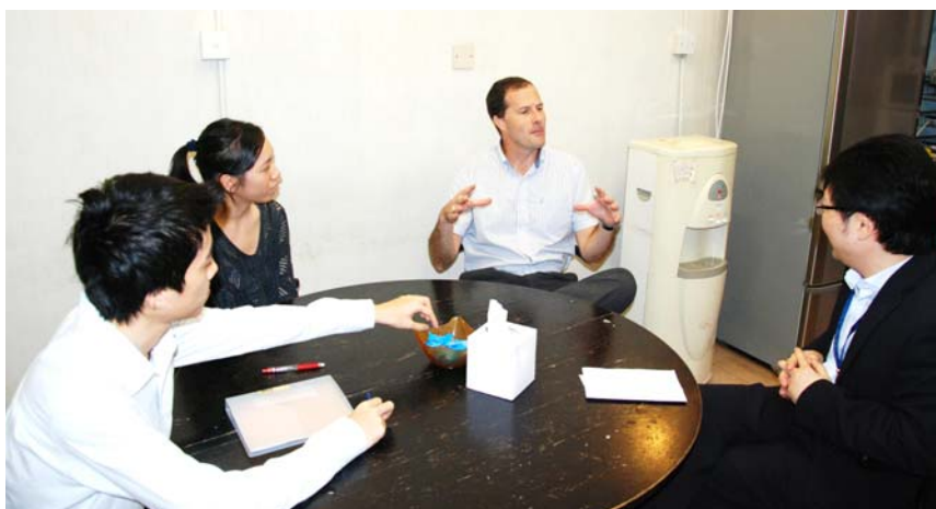
Teachers meeting with ESR team leader 外評隊長與老師面談