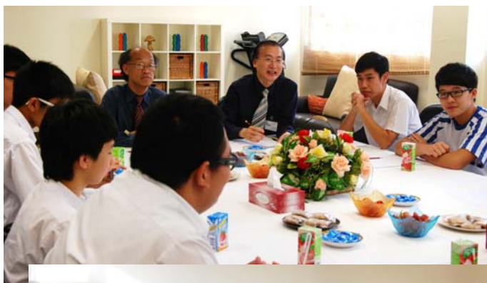
ESR team members meeting with students 外評隊隊員與學生面談