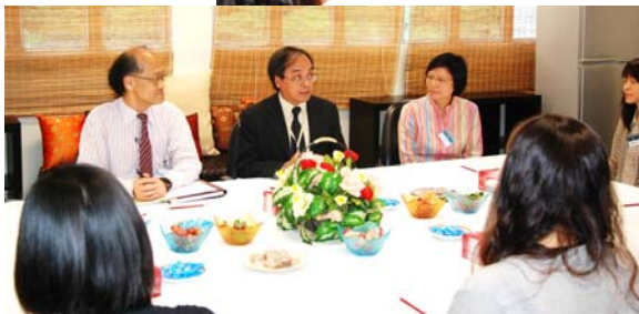
Parents meeting with ESR team members 外評隊隊員與 家長面談