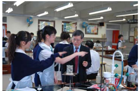
Experiment in progress 實驗課