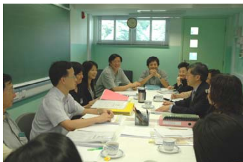
Teachers meeting with ESR team members 外評人員與老師面談