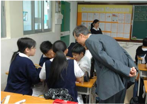
ESR team member observing class 外評人員細心聆聽同學們的討論