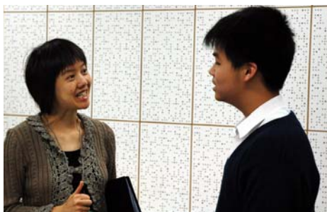
ESR team member and student in conversation 外評人員與學生交談