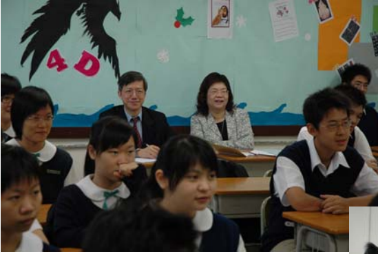
ESR team members observing class 外評人員在觀課