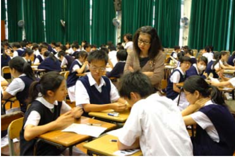
Group in interaction 同學互相交流