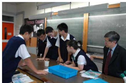
Conducting experiment 實驗課