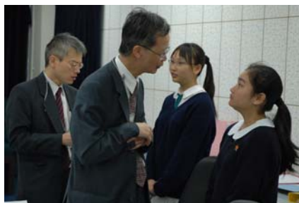
ESR team members chatting with students 同學與外評人員交談