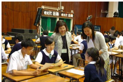
F.4 students engaging in SBA activity 同學進行中四英文校本評核活動