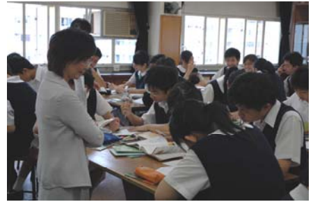
ESR team member observing class 外評人員在觀課