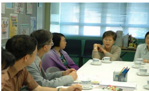
Parents meeting with ESR team members 外評人員與家長面談