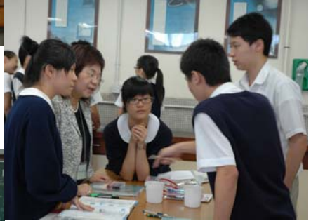
Group in interaction 小組討論