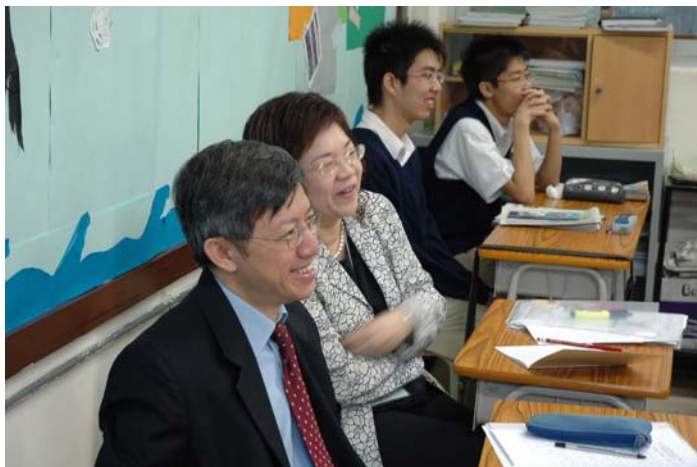
ESR team members drawn by vibrant teaching 老師生動的講解令外評人員也投入其中